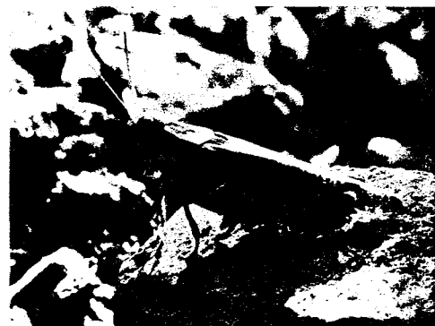
Femmina adulta in natura

L'adulto è di medie dimensioni, con lunghezza del corpo oscillante tra 15 e 23 mm per il maschio e tra 23 e 34 mm per la femmina. Il colore fondamentale varia dal bruno-grigiastro al rosso-bruno. Le ali posteriori membranose presentano un bel colore rosa vivace.