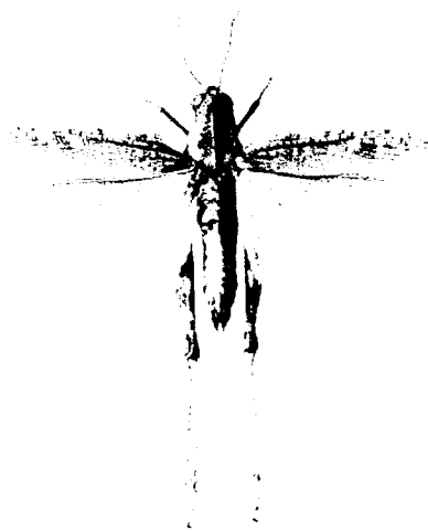
Femmina adulta preparata a secco

Il callittamo è la cavalletta dalle ali rosa che nel corso degli anni precedenti ha provocato numerosi danni in Piemonte. Si tratta di una specie estremamente polifaga, che si nutre di solito di piante erbacee: ha danneggiato infatti medicinali, prati polifiti e diverse piante da orto. In alcuni casi la specie è stata segnalata nutrirsi di foglie di vite con preferenza per le foglie basali, mentre trascurava abitualmente i capi a frutto.