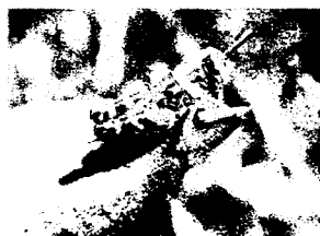
Neanidi di IIIª età