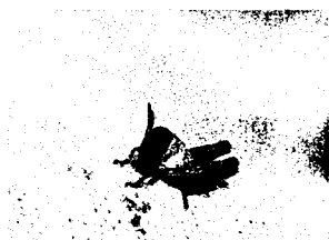
Neanidi di Iª età (lunghezza ~ 6 mm)

In primavera, a partire dalla fine del mese di maggio, i giovani fuoriescono dalle ooteche prolungando le nascite anche fino all'inizio di agosto; essi attraversano diverse età neanidali (tre) e ninfali (due) caratterizzate queste ultime dai tipici abbozzi alari. In caso di forti infestazioni i giovani ricoprono interamente il terreno per diversi metri quadrati riunendosi in massa al calar del sole su pietre e altri rilievi, rimanendo inattive fino al mattino successivo.