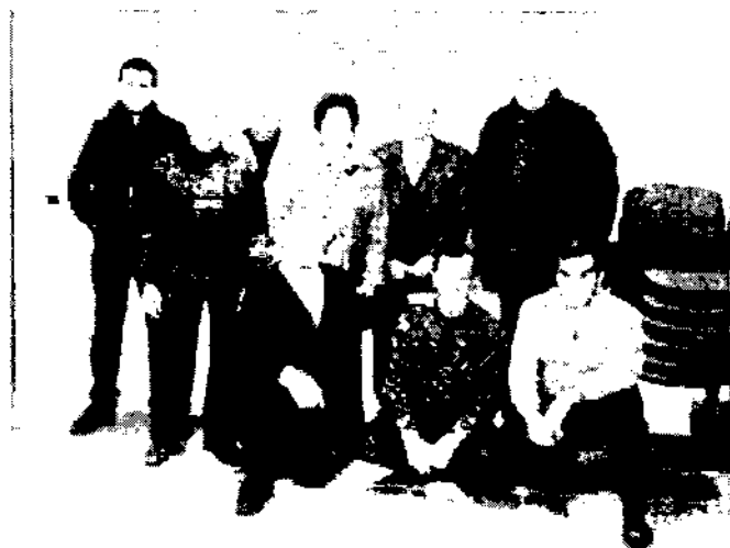
Foto del nuovo direttivo della Pro Loco

In collaborazione con l'Associazione Alpini, il nuovo Direttivo della Pro Loco avrà il piacere di porgere gli auguri di Buone Feste la notte del 24 dicembre, dopo la messa di mezzanotte, con la distribuzione sul piazzale della Chiesa, del tradizionale "vin brulé" e panettone.