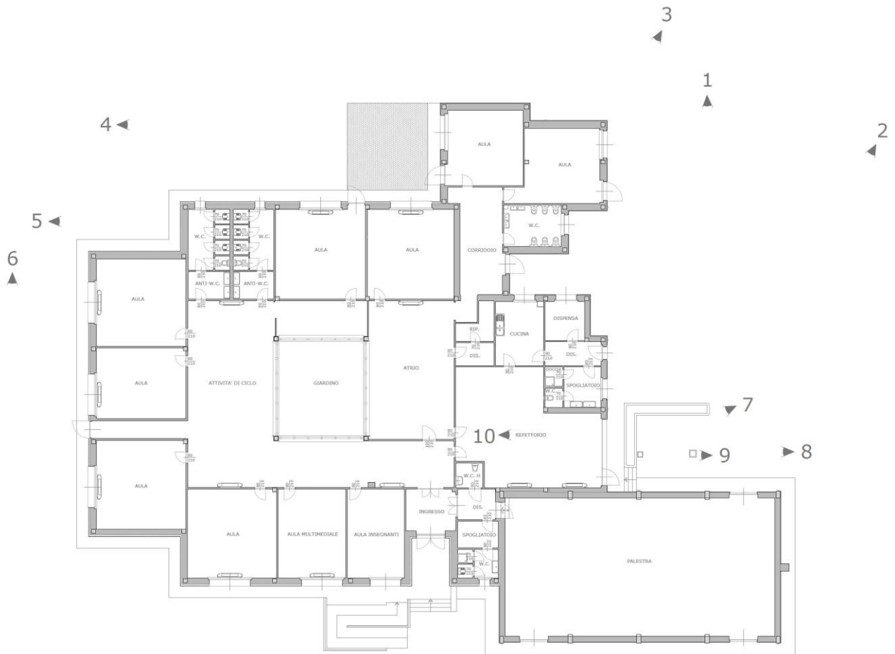
PLANIMETRIA STATO DI FATTO_PUNTI DI SCATTO